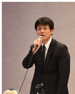
JICA 竹原課長による説明