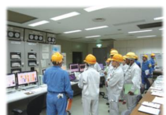
JICA・海外研修生受入