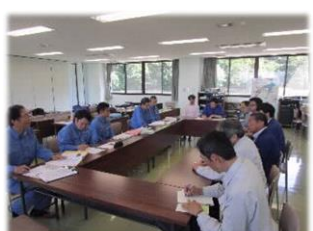
施工管理・検査支援