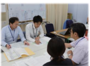
計画・設計支援業務