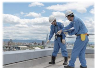
土木建築躯体点検