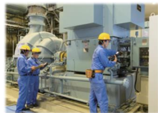
振動計による設備診断