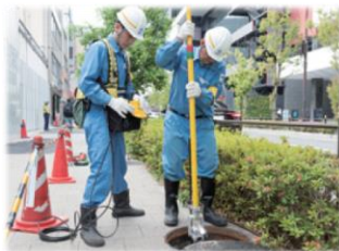
管口カメラによる点検