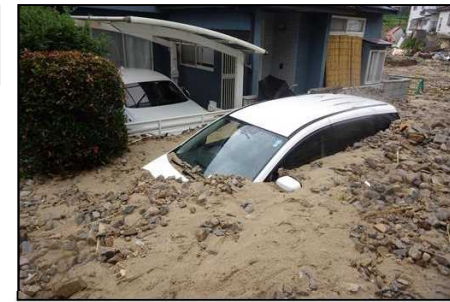
土石流により甚大な被害の発生した大谷川(東区馬木)の状況