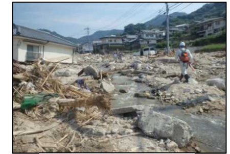
総頭川下流の河道を埋塞する大量の土砂