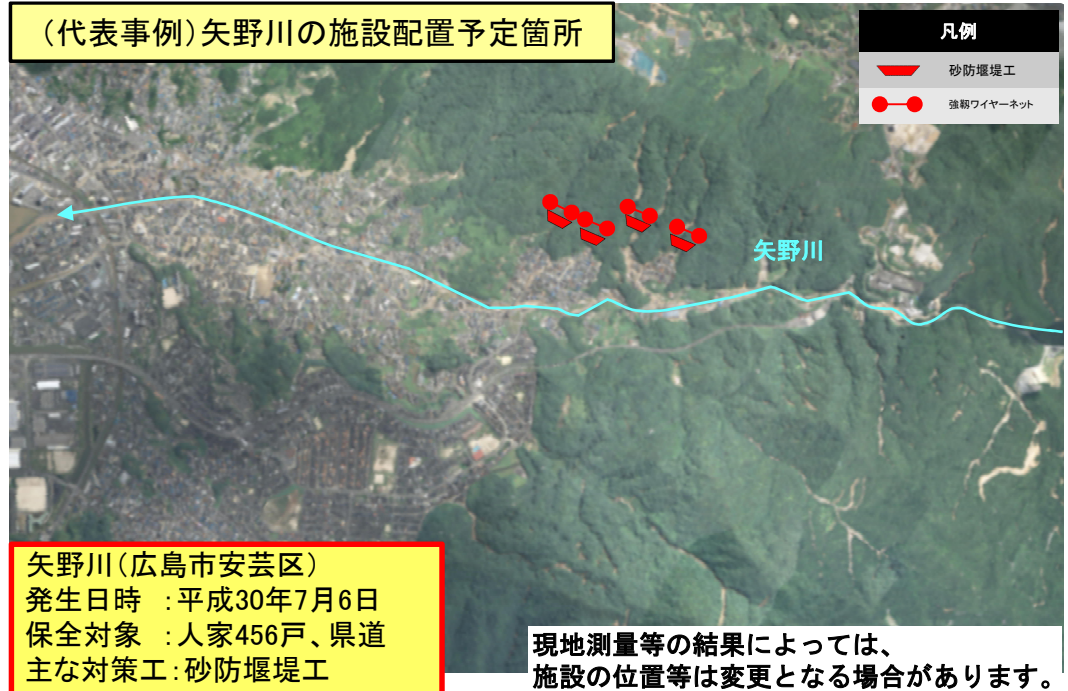
(代表事例) 矢野川の施設配置予定箇所