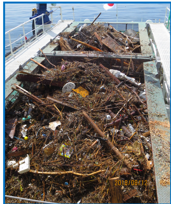
8/12:「おんど 2000」による漂流物の回収状況（倉橋島沖合）