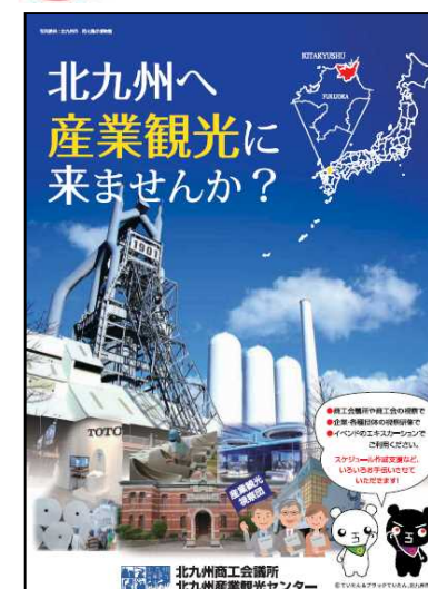
産業観光パンフレット