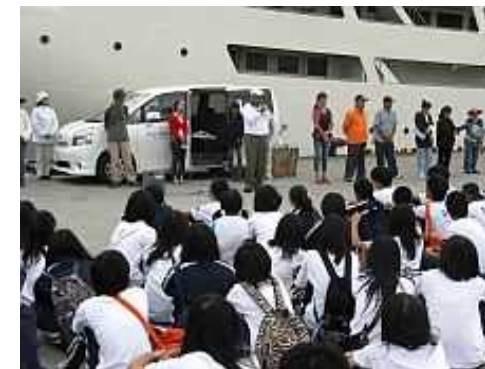
民家体験泊を行う修学旅行生への説明風景

(参考URL) http://www.iekanko.jp/guesthouses