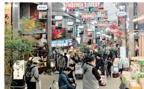
大勢の観光客で賑わう熱海市の商店街