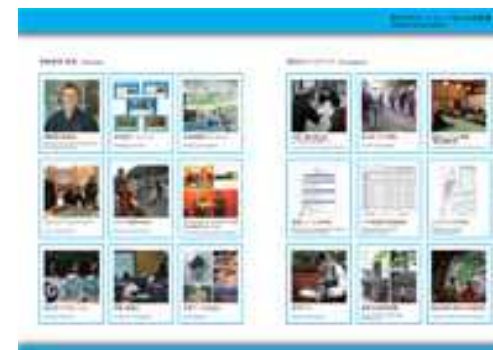
田辺市熊野ツーリズムビューロー紹介パンフレットより (観光プロモーションと受入地の整備)