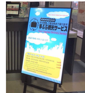
多言語でサービス情報を提供するデジタルサイネージ