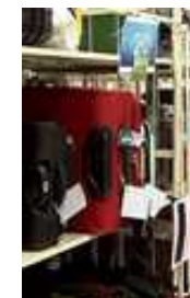
荷物を一時保管 するラック