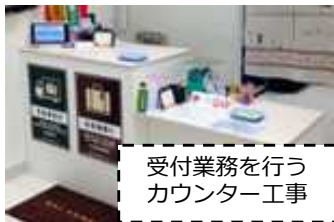
受付業務を行う カウンター工事