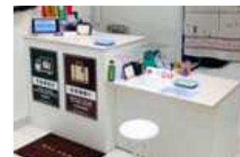
受付業務を行う カウンター設備