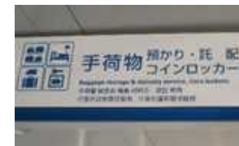
手ぶら観光カウンターの 場所を案内する看板