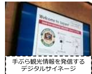
手ぶら観光情報を発信する デジタルサイネージ