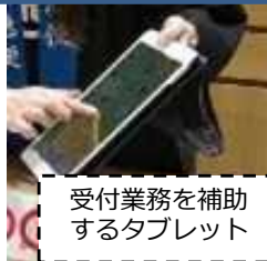
受付業務を補助 するタブレット