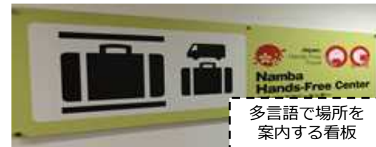
多言語で場所を 案内する看板