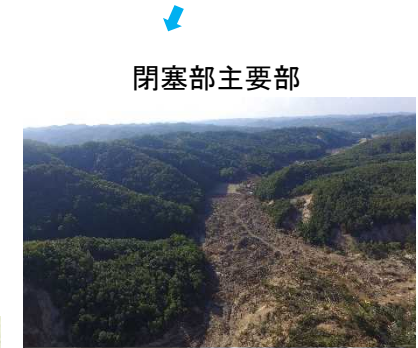
崩壊の状況(日高幌内川)