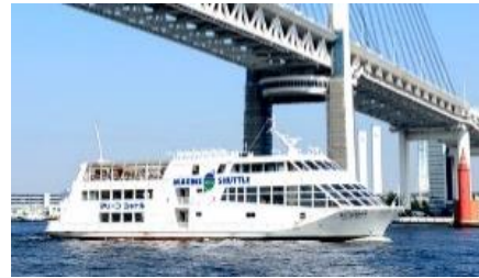
【旅客不定期航路事業者】