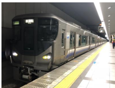
試運転の様子(17日早朝)