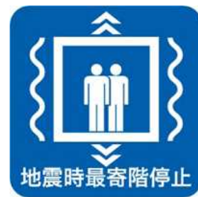
地震時管制運転装置設置済みマーク

本制度に関する詳細については、以下にお問合せください。 一般社団法人建築性能基準推進協会 電話：03-3513-7561 WEB: http://www.seinokyo.jp/