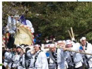
太鼓登山 (稲村神社)