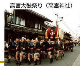
高宮太鼓祭り (高宮神社)