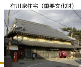
有川家住宅 (重要文化財)