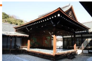
能舞台 (彦根城博物館)