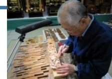
伝統工芸 (彦根仏壇)