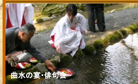
曲水の宴・俳句会