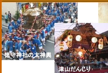
徳守神社の大神輿