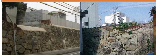
宮川門石垣(修理後)