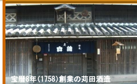
宝暦8年(1758)創業の苅田酒造