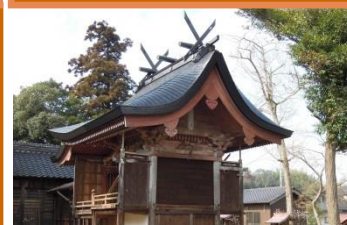
八出天満宮 本殿(修理後)