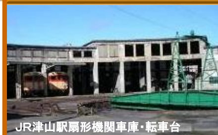
JR津山駅扇形機関車庫・転車台