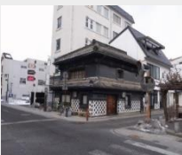
松本市登録文化財

また、登録された近代遺産の中から、文化的な価値が高く一定の要件を満たすものを松本市登録文化財として登録を行い、保存管理のための財政的な支援を行います。