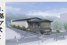
松本市基幹博物館イメージ図

「松本城およびその周辺整備計画」、「松本市基幹博物館基本計画」等に基づき、松本市立博物館を三の丸エリアの松本城大手門駐車場北棟、平面式駐車場敷地に新築整備し、現施設は解体撤去します。