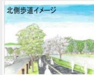
北側歩道イメージ