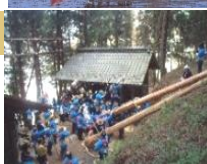
橋倉神社の建て御柱 ▶

御柱祭は7年に1度、本殿等の四隅に巨大な柱を建てるお祭りで諏訪の信仰が根付いている地域で主に行われています。氏子たちが結束し、それぞれの鎮守を中心に行っている様々な祭りは懐かしい風情を醸し出しています。