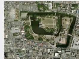
事業着手前の現状(上空から)

南・西外堀の復元整備により、松本城と城下町が一体となった歴史的景観を創出し、城郭としての風格や魅力の向上を図ります。