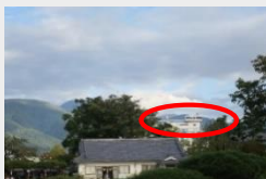
現市役所庁舎 (高さ制限を超過している)

松本城に隣接する現市役所庁舎については築年数が60年を経過して老朽化し、また、都市計画法に定める高度地区の指定前に建設されたため、高さ制限を超過し、景観上の課題があります。建替えの方向性については今後検討を行います。