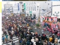
あめ市でにぎわう本町通り ▶

あめ市は商都松本の冬の代表的行事で、市神様を祭り、一年の商いを占う初市があめ市と名を変えて引継がれています。その経済力により、旧開智学校校舎は住民の寄付を受けて建築されました。そして保存活動の結果、今の姿を伝えています。