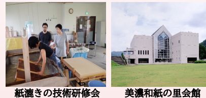
紙漉きの技術研修会