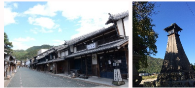
美濃市美濃町 伝統的建造物群保存地区