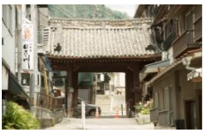
常称寺大門 (保存修理を予定)