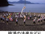
棕浦の法楽おどり

鉦太鼓おどりは、鉦や太鼓を打ち鳴らしながら、様々な陣形を変えて踊る風流踊です。(図に關係する祭礼行事)