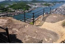
尾道水道や市街地などを望む眺望点(浄土寺山の山頂付近)