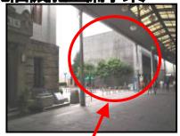
老朽化した建物を取壊し、広場として整備する