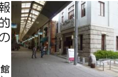
尾道商業会議所記念館(旧尾道商業会議所)