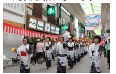
みなと祭でのパレード

ゴールデンウィークに「みなと祭」が開催されます。住吉浜の築造を主導した町奉行・平山角左衛門の功績を称え、尾道の発展を願う祭です。