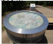
案内部分が劣化している潮音山公園の案内板