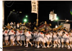
祇園祭の三体廻し

八阪神社では、毎年7月初旬、祇園祭が行われます。勇壮な三体神輿の練り歩きや三体廻しは、江戸時代から行われています。