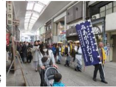
みあがりおどり披露

・文化遺産まつりの開催や文化遺産マップの製作配布 →民俗芸能等や文化遺産の普及啓発