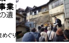
近代化遺産めぐり