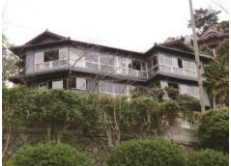
整備例:みはらし亭