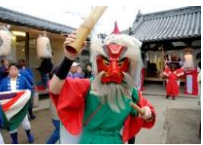
「ささら」を持つショッキー

ベッチャー祭は、一宮神社に伝わる尾道の晩秋を代表する行事です。ショッキー・ソバ・ベタの鬼の格好をした若者が街へ繰り出します。