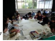
おたからマップづくり