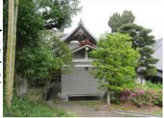
光明寺文化財収蔵庫