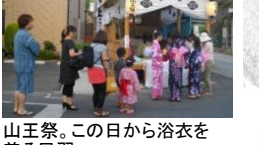
山王祭。この日から浴衣を着る風習

山脇神社の祭礼は、「山王祭」(別名「ゆかた祭り」)と呼ばれ、旧暦4月の申の日(5月末)に行われます。