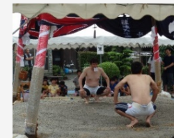
中村の安産祈禱相撲