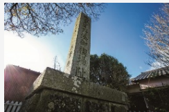
さいおうのおのみなとおんみそぎばあと 齋王尾野湊御禊場跡