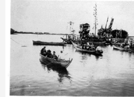
海上渡御(大淀祇園祭)

町内には民俗行事として、大淀祇園祭や宇爾櫻神社天王踊り等が受け継がれています。こうした行事は、地域の人の手で古くから受け継がれてきており、農村と漁村を舞台として、町民の情熱と地域が一体となった伝統的な祭りの風情を感じさせています。