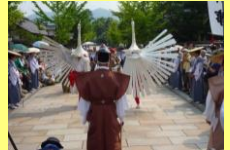
津和野弥栄神社の鷲舞