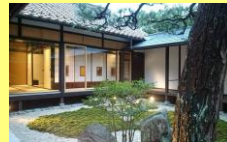
整備後(簡易宿泊所として活用)