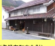
華泉酒造場(登録有形文化財)

旧城下町一帯では、青野山の伏流水が各所に湧き出ており、現在も4軒の酒造場が、登録有形文化財を含む歴史的建造物を利用して酒造りを行っています。