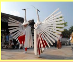
津和野弥栄神社の鷲舞

重要無形民俗文化財の津和野弥栄神社の鷲舞は、毎年7月20日と27日に弥栄神社や歴史的建造物が数多く残る旧城下町で行われます。