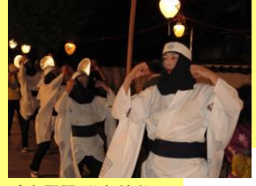
津和野踊(盆おどり)

殿町通りをはじめとした旧城下町では、仏教行事として4月の花まつり、盆の津和野踊(県指定無形民俗文化財)が、宗派を超えて行われます。