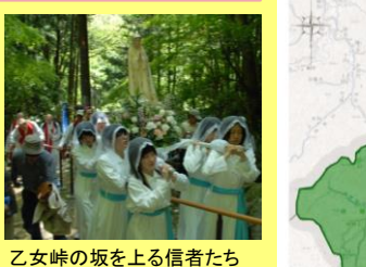
乙女峠の坂を上る信者たち

乙女峠まつりは、毎年5月3日に開催され、津和野カトリック教会(登録有形文化財)をスタートし乙女峠まで行進し、ミサが行われます。