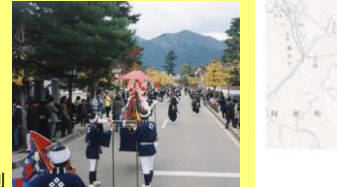
殿町通りと奴行列

奴行列は、殿町や本町通りなど旧城下町を練り歩きます。藩主の参勤交代を模したものです。