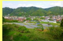
国道9号から見る 棚田と街の風景