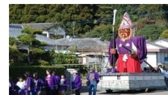
御神幸行列(別体弥五郎様)

田ノ上八幡神社で行われる弥五郎人形行事は、神社の祭祀として南九州に伝えられてきた。形態を変化させながらも大切に継承されている弥五郎人形や御神幸行列は、住民の世代間の交流や歴史への興味を抱かせる役割を担っている。