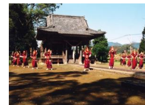
泰平踊(五百禊神社)

泰平踊は、江戸時代前期から飢肥城下町に伝わる盆踊りの伝承である。登録有形文化財である五百禊神社の庭園においても泰平踊が踊られ、現在まで伝えられている。飢肥のイメージを代表する優雅な踊りが由緒ある建造物と一体となって、格調高い雰囲気醸し出している。