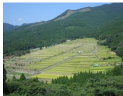
飢肥杉林と坂元棚田

坂元棚田は、中山間地の不利な条件を克服し、遠距離から水路をひいてくことで水田耕作を継続してきた。そして、住民の手によって守られてきた棚田の周囲には、飢肥杉林が広がり、農業と林業を両立してきた住民の努力が、現在の美しい景観を生み出している。