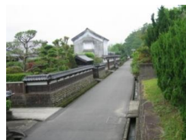
横馬場の石垣や生垣

飢肥石による石垣や石塀が数多く残されている飢肥地区は、往時の歴史的景観を維持している。また、石垣の所有者や住民が常に石垣を管理し、美しく保つことで、飢肥の町並み景観を向上させている。その美しく保たれた飢肥石で囲われた屋敷地と飢肥杉の住宅が城下町の佇まいを今に伝えている。