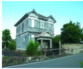
守永家 (旧飯田医院)

歴史的な建造物である旧飯田医院と主屋について、公開活用を図るため、屋根、外壁、内装等の全面改修を行い、観光案内や休憩、地場製品の販売、軽食の提供を行います。