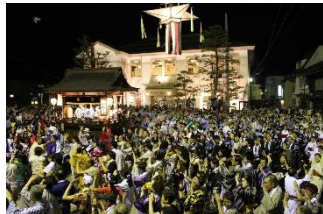
発祥祭(旧八幡町役場庁舎前)

郡上おどりは近世の城下町で踊られていた盆踊りを体系化しながら継承されてきた。城下町の町割を継承した歴史的な町並みに、お離子とおどりが溶け込んで歴史的風致を生み出している。