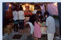
子守地藏尊 地藏盆