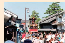
有松の町並みと祭り