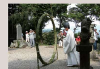
尾張戸神社 茅の輪くぐり