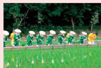
大高斎田御田植祭