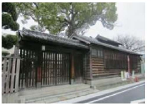
認定51号 旗屋小学校武家屋敷門

市内に残る身近な歴史的建造物を登録・認定するとともに、保存活用に向けた技術的支援及び経済的支援を実施します。