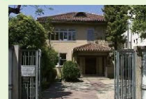
文化のみち榎木館