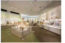
体感!しだみ古墳群ミュージアム

志段味古墳群のガイダンス施設である「体感!しだみ古墳群ミュージアム」の公開を継続するとともに、企画展示の開催や体験プログラム等の活用事業も実施します。