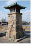
宮の渡し公園常夜灯

宮の渡しや宿場跡、白鳥庭園など数多くの地域資源を活かし、地域全体の魅力向上につながるまちづくりを推進します。