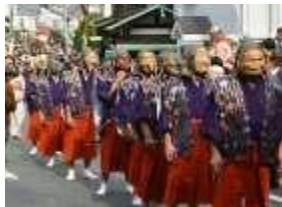
めんかけ ▲面掛行列

日本最古の港跡「和賀江嶋」が位置する材木座をはじめとする地域では、江戸時代頃から現在に至るまで、海にまつわる生業や伝統行事が営まれている。