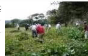
▲鎌倉風致保存会の活動

歴史的遺産は自然環境と一体を成して歴史的風土を形成しており、多くの人々が緑地の保全に携わることでそれが保たれている。