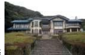
▲鎌倉文学館 (旧前田家別邸)

この地に別荘を構えた人々の価値観は、習慣、生業、芸術等に影響を与え、地域固有の自然的・歴史的背景や人的・物的交流等を通じて洗練され、現代の鎌倉に住まう人々の趣向等にもその諸相が見られる。