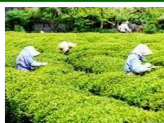
市街地内の茶畑での茶摘み作業

市街地内の茶畑での茶摘み風景や新茶の時期に町中に広がる茶の香りはこの地域の季節の風物詩であり町中で季節を感じる歴史的風致となっている。