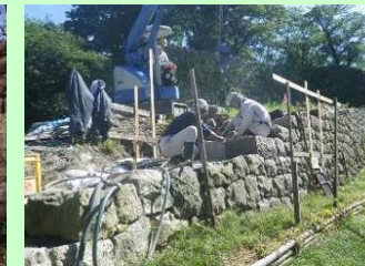
村上城跡石垣修復作業