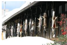
町家の軒下に吊るされた塩引き鮭

三面川の鮭は、村上藩の財政を支えながら城下の形成発展に寄与し、現代に至るまで多様な文化や生業を育むとともに関連文化が現在まで受け継がれている。