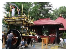
しゃぎり屋台の組み立て

村上大工が携わる社寺や武家住宅、町家などの修復作業や彫漆工芸の代表作である村上まつりのしゃぎり屋台の点検、修理する風景は社寺や町家などの町並みと一体となり歴史的風致を形成している。