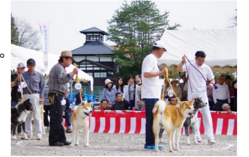
秋田犬本部展覧会

市内各地に秋田犬の像やデザインがあり、秋田犬を愛する市民の深い愛情が受け継がれている。