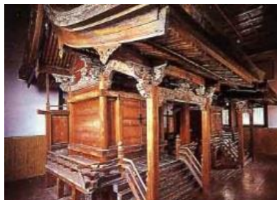
重要文化財(大館八幡神社)

大館八幡神社や桜櫓館、大館神明社などの歴史的な建造物を保存補修し、後世に継承する。