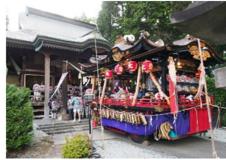
大館神明社に参拝する山車

また城下にかかれた「市」が起源と伝えられる大館アメッコ市が冬の風物詩として現代に受け継がれている。