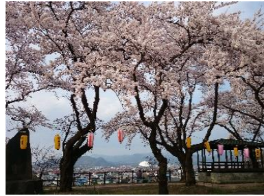
桜が満開の桂城公園

大館城本丸跡の桂城公園を、新庁舎建設事業と連携して、城址公園にふさわしい景観の形成と、にぎわいの創出をめざす。