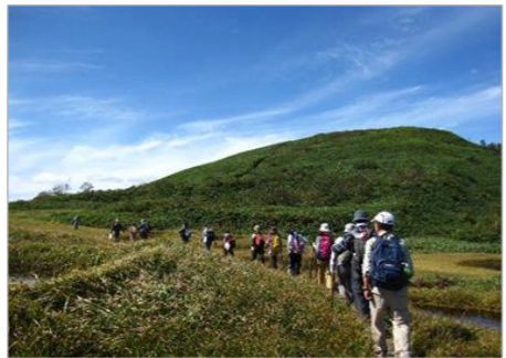
半夏生の参拝登山

山頂の田代山神社の例祭を訪れる参拝者は、豊作と家内安全を願い、笹やツゲを持ち帰り、田の水口に立てて虫除けとする習わしが今も続いている。