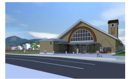
ハチ公の駅(仮称)整備イメージ図

天然記念物秋田犬の歴史や文化の情報を発信し、地域の歴史的な資源を巡るまち歩きの推進を図る。