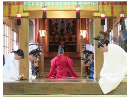
扇田神明社例祭の神事

扇田の人々は古くからの例祭や行事を、伝統としきたりを守って現代に受け継いでいる。