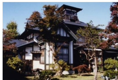
登録有形文化財(桜櫓館)