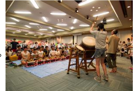
大館囃子の合同練習会

民俗文化財や郷土芸能の調査や記録保存を行い、活動を継続するための支援につなげる。