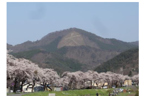
市街地からみる鳳凰山

貯水池の周辺にはたくさんの桜が植樹され、四季折々の姿を見せる鳳凰山大文字とともに、ふるさとの風景として多くの市民に愛されている。