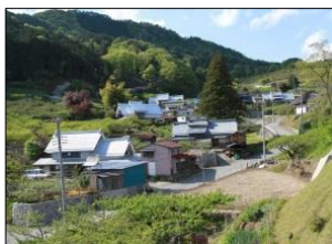
上条伝統的建造物群保存地区

市街地と山間地をつなぐ青梅街道沿いには、山間の地区で同じ日に行われる2神社の祭礼についての 神部神社と金井加里神社の祭礼にみる歴史的風致 、塩山地域の中心市街地に息づく 塩ノ山南麓の市街地の営みにみる歴史的風致 があります。