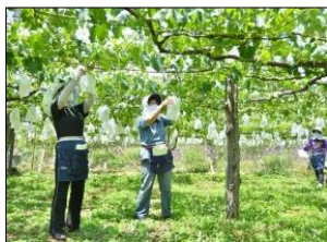
勝沼地域のブドウ栽培

長く培われてきた果樹栽培に関するものとして、松里地区の伝統産業である コログキ生産にみる歴史的風致 、勝沼地域の圧倒的な景観をつくる ブドウ栽培にみる歴史的風致 、広大な土地にくまなく水を送るための 笛吹川水系のセギにみる歴史的風致 があります。