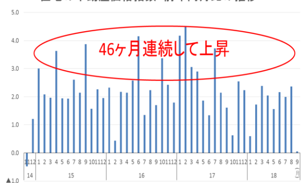
住宅の不動産価格指数 前年同月比の推移

〈問い合わせ先〉土地・建設産業局不動産市場整備課 課長補佐 藤木（内線 30-222）