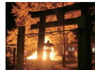
小倉老松神社の鳥居を映し出すコモツギの炎

本町には『元禄絵図』に描かれた集落が遺っている。各集落には守り神としてのお宮があり、集落の人々は氏子となって、毎年祭事を行っている。各集落の個性が表れた祭りの風景は、本町に息づいた季節の節目を物語る歴史的風致である。