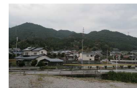
集落の景観（城戸地区）

長崎街道や城戸、丸林地区等の集落において歴史的風致を阻害する建築物や工作物の修景を推進し、補助を実施する。これにより、歴史性を有する道路や基山からの眺望景観等の改善を図る。