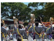
御神幸祭大祭での鉦風流演舞