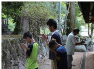
荒穂神社神殿裏で基山を向いて拝礼する人々の姿