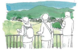
きやまんもん文化遺産情報館（仮称）整備イメージ（基肆城跡保存整備基本計画より）

歴史と文化の情報を発信し、かつ、関係団体の活動拠点となる施設を整備することで、情報共有を図り、広がりあるまちづくり活動へ結びつける。また、多世代交流施設としても活用する。