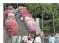
つつじが彩る大興善寺の石段