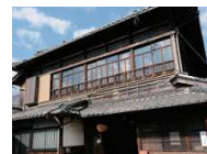
長崎街道沿いにある基山商店

江戸時代から長崎街道上の間宿として栄えた木山口町では、配置売業で栄えるとともに、交通の利便性を活かした物流が発達した。現在も、長崎街道に沿って並ぶ歴史的な建造物や人や物の往来から、本町に受け継がれてきた産業の歴史を垣間見ることができる。