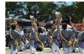
御神幸祭大祭での鉦風流演舞

伝統的民俗芸能に対して、学識経験者の指導、助言に基づき、道具や衣装の修理費を補助する。これにより、毎年催行される民俗芸能への参加意欲の向上を図る。