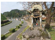
古四国霊場14番札所

霊場札所を巡礼する「だろだろまいり」の巡礼地である本町では、白装束を身にまとったお遍路さんが町を歩く姿が馴染みの風景となっている。町民は催行者への接待を通し、神仏や人とのつながりを認識し、春と秋の訪れを感じる。