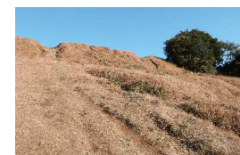
登山者によって崩壊する基肆城跡の土壁

特別史跡基肆城跡の遺構保存修理が一部にとどまり、遺構の劣化が史跡景観を損ねていることから、より多くの遺構の保存修理等を実施する。