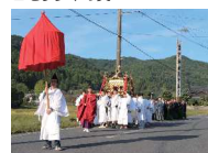
園部くちでの御神幸の様子