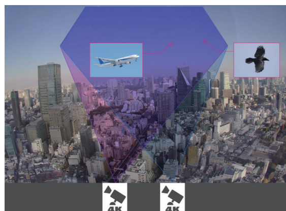
窓際に設置した複数のビデオカメラで監視