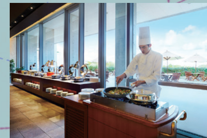
ウェスティンホテル淡路