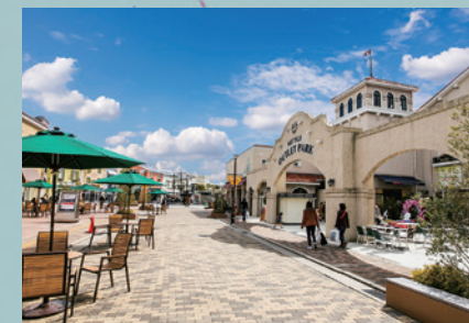
三井アウトレットパーク マリンピア神戸

※ 地図上のルートに関わらず、実際の交通規制に従ってください。また、気象・海象条件、海上工事の状況、漁具等に十分注意のうえ航行願います。