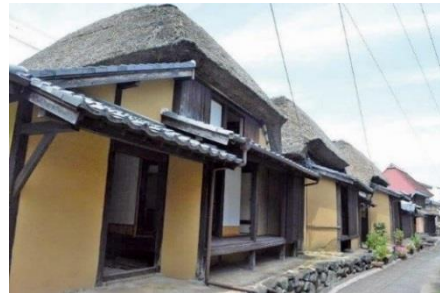
【鹿島市浜庄津町浜金屋町 伝統的建造物群保存地区】

重要伝統的建造物群保存地区 かしまし はまなかまち 「鹿島市浜中町 八本木宿 はちほん ぎしゆく 伝統的建造物群保存地区」及び「鹿島 市 はましようづ まちはまかな や まち 浜庄津町浜金屋町伝統的建造物群保存地区」 並びにその周辺地域と、 はま き おんまつり ゆうとく い なり 浜祇園祭や祐徳稻荷神 社への参拝といった伝統的行事等からなる歴 史的風致の維持向上を図るため、重要伝統的建 造物群保存地区の歴史的建造物等の保存修理、 祐徳稻荷神社の参道の美装化、伝統行事で使用する用具の修理や後継者育成に係る 支援に関する事業等が位置づけられています。