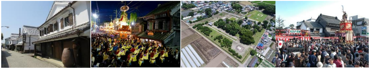
【鹿島市】鹿島市浜中町八本木 宿伝統的建造物群保存地区