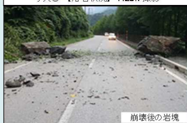
【対策内容】 根固工 V=3,800m³