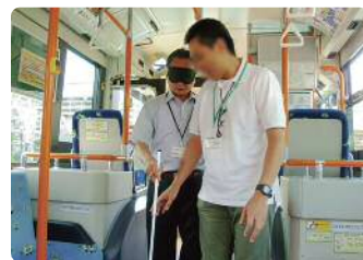
バス車内での実技演習(視覚障害)