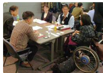
講師を務めた障害当事者も加わり、参加者(他社)どうしの意見交換

このプログラムは一例であり、実際の研修時には各コマの配分時間が変わる場合があります