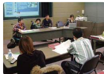
障害当事者からの講義