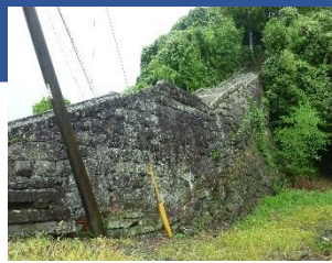
歴史的風致形成建造物の候補

伝統的建造物群保存地区を除く重点区域全域において、歴史的風致形成建造物に指定された建造物についての保存修理を実施する。これにより、これまで指定等が行われていなかった歴史的建造物の保存・活用を推進し、歴史的風致の維持及び向上につなげる。