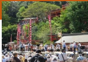
かしま伝承芸能フェスティバル

本事業では、市全域に分布する浮立や獅子舞といった民俗芸能をはじめとした伝承芸能を披露する場として、祐徳稲荷神社境内において「かしま伝承芸能フェスティバル」を開催し、民俗芸能の技術伝承および市内外の見物客への認知向上につなげる。