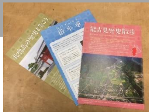
「歴史さんぼシリーズ」の一部

本事業では、市内の各地区の歴史や文化を分かりやすく伝えるためのガイドブックである「歴史さんぼシリーズ」の作成を継続して行っていく。また、これまでのシリーズと合わせた統合版を作成し、鹿島市の歴史や文化についての認知向上を図る。