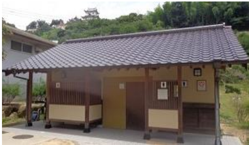
【外観写真】(新築等の場合はパース等)