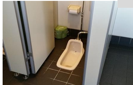
【改修する便器写真】(改修の場合は必須)