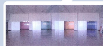
別府インキュベーション スクエア（みなとパレット）