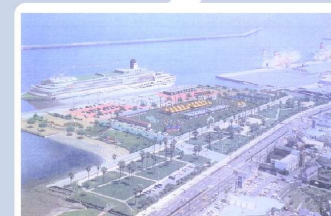
別府国際観光旅客ターミナル完成イメージ図（国土交通省地方整備局）