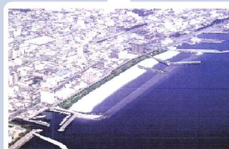
餅ヶ浜地区 完成イメージパース