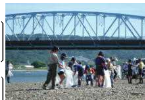
河川周辺の清掃活動

7月1日から7日までを「河川水難事故防止週間」と定め、出前講座等により水難事故防止に関する啓発活動を行います。