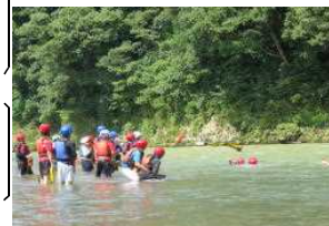
水難事故防止講座