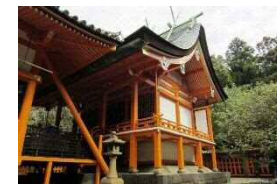
早吸日女神社本殿

佐賀関地区は、古代から続く港町である。早吸日女神社の祭礼は、佐賀関に住む人々が広く参加して行われる祭りで、神輿や山車の巡行は、まちの広範囲におよぶ。祭礼は、海との繋がりを基本としながらも当地区がもつ伝統をすべて含んでいる。このように、早吸日女神社と祭礼により良好な歴史的風致を形成している。