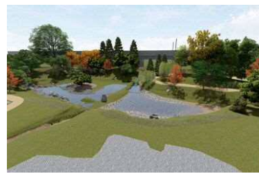
大友氏館跡庭園整備イメージ CG