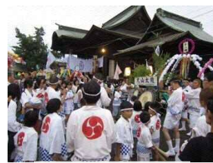
祭礼 浜の市の様子

杵原八幡宮の祭礼は、八幡地区の人々が参加して受け継がれており、それが行われる道や建物が一体となって、歴史的風致を形成している。