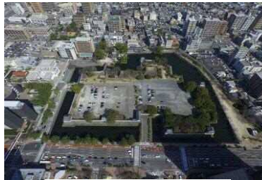
大分城址公園の現在の様子