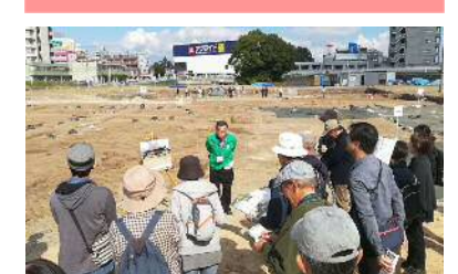
大友氏遺跡について説明する市民ガイド