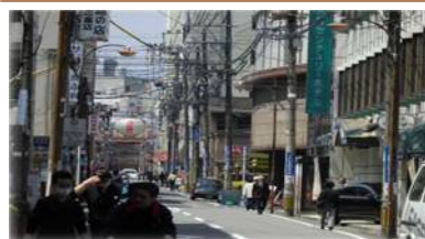
歩行空間を阻害する電柱