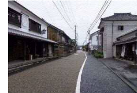
戸次本町のまちなみ

戸次地区は、大分市内でも最も良好な歴史的なまちなみが残っており、江戸時代には臼杵藩の在町としての歴史と伝統を受け継いでいる。このまちなみを守り、次世代へつなげていこうとする地元住民の熱意のもとで、伝統的な祭礼が守り伝えられており、まちなみと一体となった歴史的風致が形成されている。