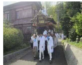
八幡神社 春季祭礼の様子

本神崎地区では、神輿や山車を用いた伝統的な春季祭礼がまち全体を舞台として行われている。また、昭和初期に発見された「石棺」を祀るために始められた祭礼も既に伝統行事となり定着している。その舞台となる八幡神社と築山古墳を起点とする2つの祭礼が当地区の人々によって受け継がれながら歴史的風致を形成している。