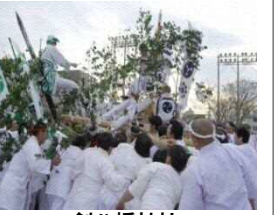
剣八幡神社 春季祭礼の様子

鶴崎地区は、江戸時代に熊本藩領であり、参勤交代の際には藩主休憩所としてまた、肥後熊本藩の豊後領における拠点を統治する拠点として「御茶屋」が設けられ、その周辺に港や町が整備された。熊本藩とのつながりに起源をもつ建造物とそれに関わる祭礼が今も受け継がれており、まちなみと一体となった歴史的風致を形成している。