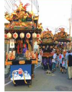
山車巡行中の様子

萩原地区は岡藩の港町として整備され、府内藩の所領となってから製塩業によって町が栄えた。江戸時代には人形を町に飾る行事があり、人形山車として引き継がれている。このような歴史的な背景とまちなみを人形山車が巡行する祭りが幅広い世代により維持され、まちなみと祭礼行事が密接に結びついた歴史的風致を形成している。