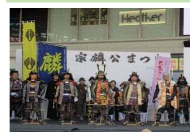
宗麟公まつりの様子