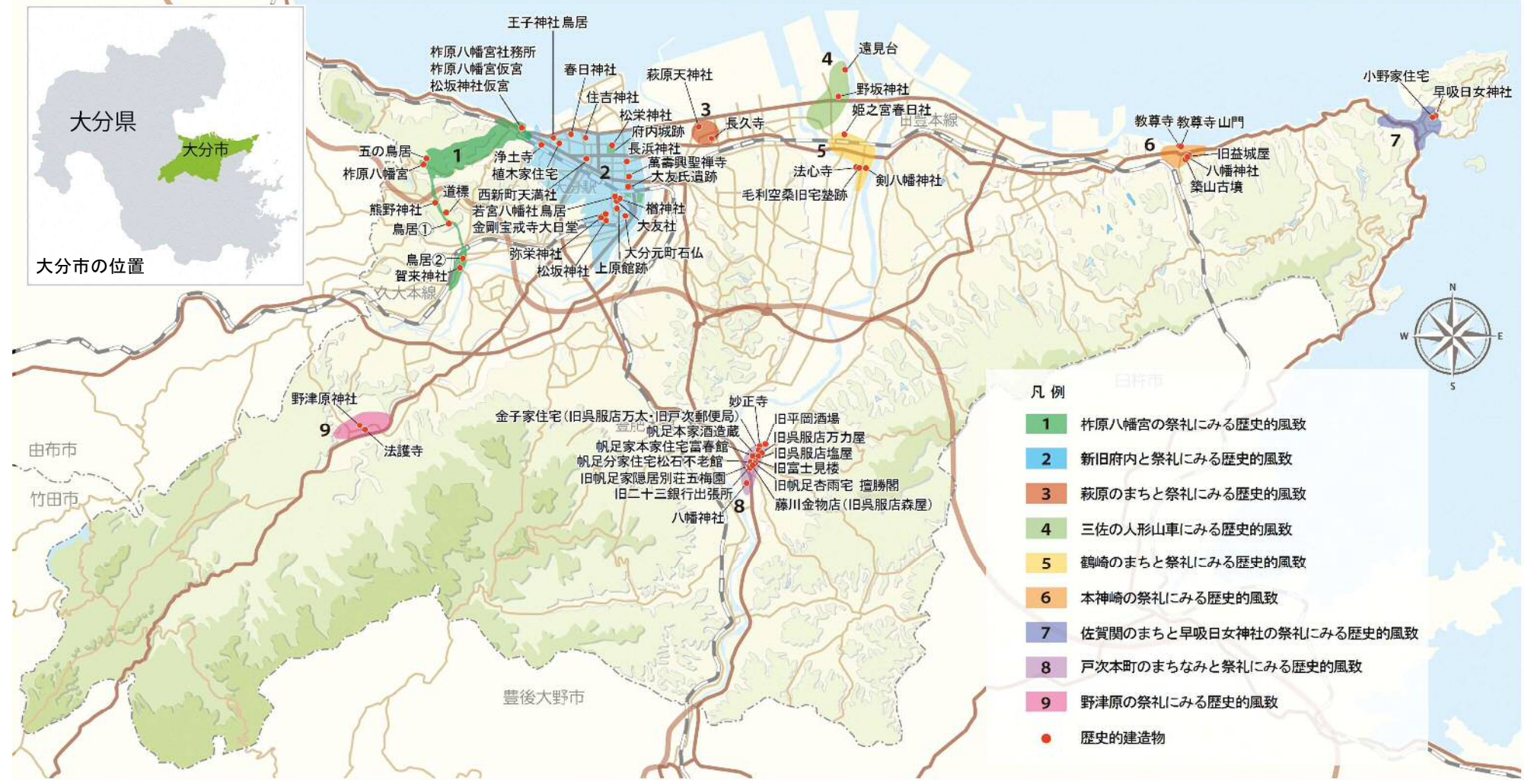
大分市における歴史的風致の分布図

古代には、豊後国府がおかれて政治的な中心地になるとともに、由原八幡宮（明治以降は杵原八幡宮と表記）をはじめ多くの社寺が創建され、中世には大友氏のもとでその本拠地「府内」が都市としての発展を遂げ、「大友氏館跡」など多くの遺跡や文化財が今に遺されている。一方近世には、府内藩など5つの藩領と幕府領に分かれ、領域ごとに異なった歴史を積み重ねた結果、各地に特色ある伝統文化が育まれることとなった。このような歴史を反映して、本市には多くの歴史的建造物や地域性豊かな伝統文化に根ざす人々の活動が今も残っており、これらが一体となって本市の歴史的風致を形成している。