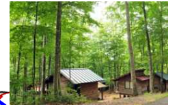
山陰海岸ジオパーク圏域3府県周遊観光活性化計画エリア