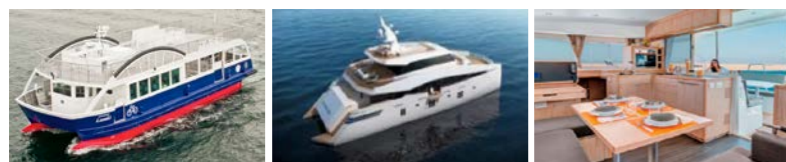
サイクル&クルーズ