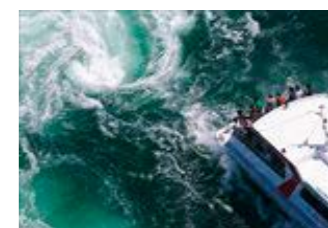
▲最前線で渦潮を体験!