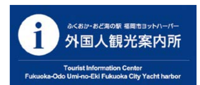
▲JNTO認定外国人案内所の看板