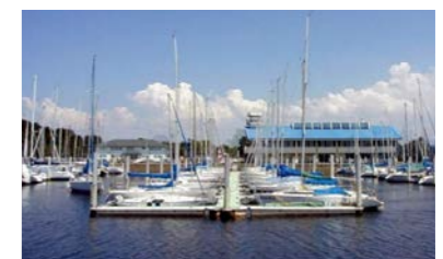
▲沢山の船が停泊しています!