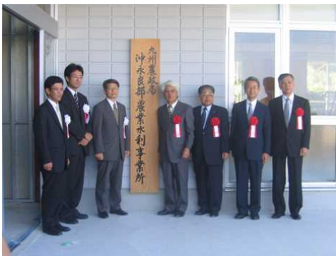
国営沖永良部農業水事業所 開所式