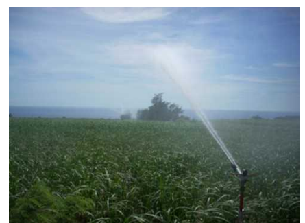
さとうきびへのかん水