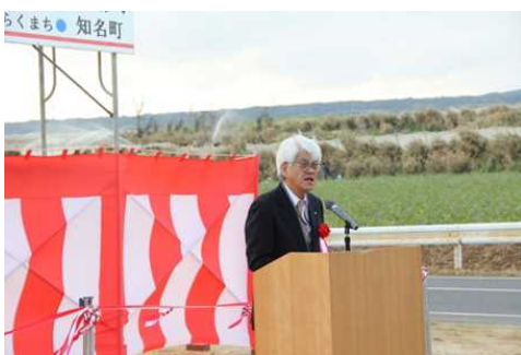
地下ダム通水記念式典