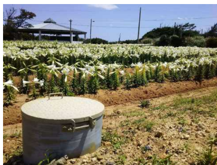
エラブユリと給水栓