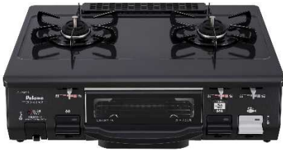
④パロマガステーブルコンロ 水なし片面焼 【株式会社 パロマ】