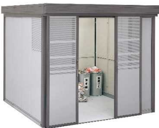
⑯ヨドダストピットFタイプ 【株式会社 淀川製鋼所】