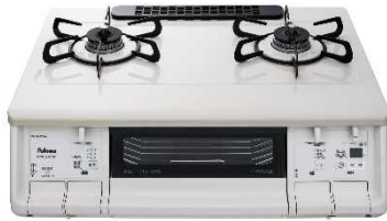
②パロマガステーブルコンロ EVERYCHEF 【株式会社 パロマ】