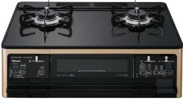
①パロマガステーブルコンロ GRANDCHEF 【株式会社 パロマ】