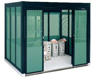
⑮ヨドダストピットHタイプ 【株式会社 淀川製鋼所】