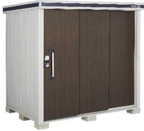
⑩ヨド物置 【株式会社 淀川製鋼所】