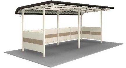
⑫ヨド自転車置場 【株式会社 淀川製鋼所】