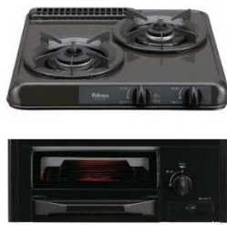
⑧パロマガスビルトインコンロ ミニキッチン 【株式会社 パロマ】