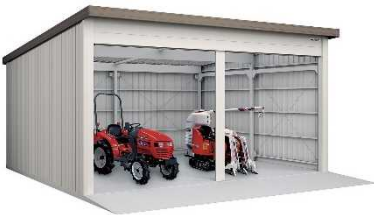
⑬ヨド倉庫 【株式会社 淀川製鋼所】