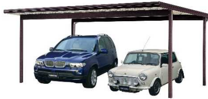
⑪ヨドカーポ 【株式会社 淀川製鋼所】