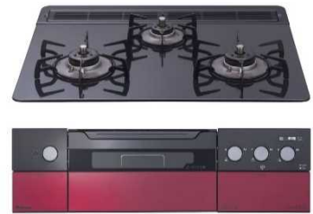
⑥パロマガスビルトインコンロ crea 【株式会社 パロマ】