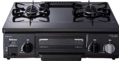
⑤パロマガステーブルコンロ コンパクト 【株式会社 パロマ】