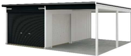
⑭ヨドガレージラヴィージュ 【株式会社 淀川製鋼所】