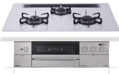
⑦パロマガスビルトインコンロ Faceis 【株式会社 パロマ】