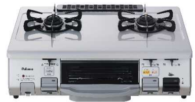
③パロマガステーブルコンロ あじわざ 【株式会社 パロマ】