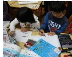
④パッケージデザイン