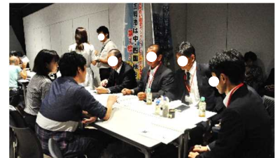
過去の「しまっちんぐ」の様子