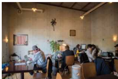
Caféでのリモートワークの様子