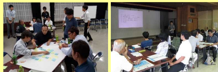
ワークショップの様子

島の住民、事業者、行政関係者等が集まり、コーディネーターを中心として島の課題を明確にするとともに、島の未来のビジョンとそれに向けた取り組み内容(プロジェクト)について話し合う。