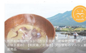
利尻お味噌汁セット (カット昆布、乾燥銀杏藻、おぼろ昆布)

ECサイトである「au WALLE Market」内の「しまものマルシェ」において、利尻島の産品を販売。