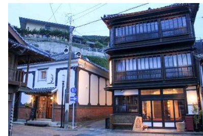
旅館等のリノベーション