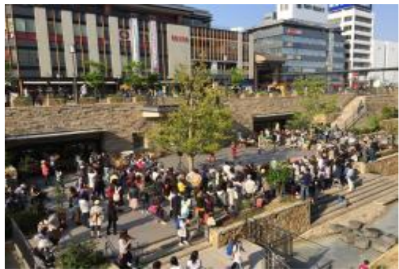
駅前の緑地とサンクンガーデン