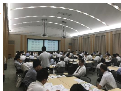
H30年度上半期 関東ブロックにおける研修会場