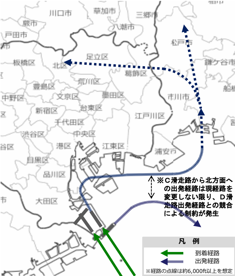
現行飛行経路 (離陸・着陸合計：80回/時)