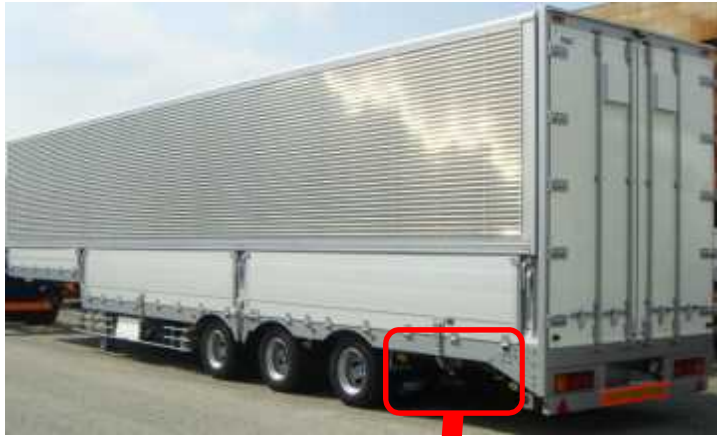
15インチドラムブレーキ仕様 セミトレーラ