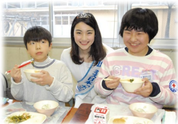
▲ 平成31年学校給食（水の天使と）

天候不順が続く冬野菜の調達に困っていた学校給食。 下水道資源（消化ガス発電の余熱）を使ってハウス栽培、安価な安定供給システムを構築しました。