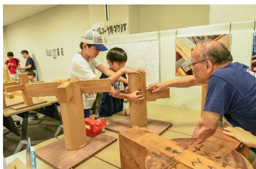
木造建築からの挑戦状！ ～君は解けるか！？木組みのパズル～