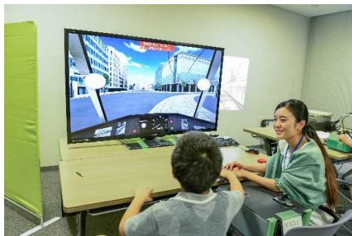
鉄道の運転を体験してみよう ～鉄道運転シミュレーター～