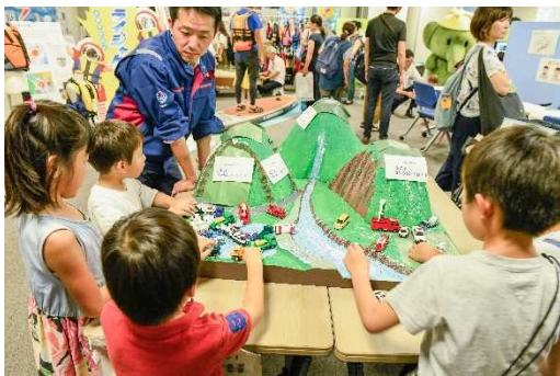
災害から地域をまもろう！～ユニフォーム を着てTEC-FORCEに変・身！！～