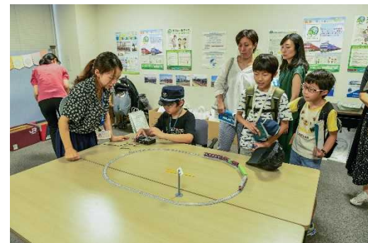
鉄道大好きキッズ集合 ～貨物列車が運ぶエコロジー～