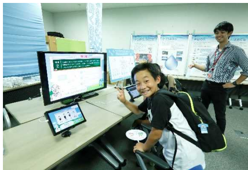
水について考えよう！ ～「巧水（たくみ）検定」を行うよ～