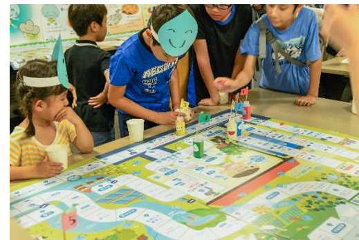
「水循環すごろく」で雨つぶの旅を 体験しよう！