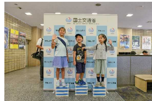
[和洋食堂] キッズメニュー