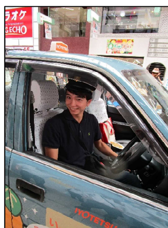
タクシー運転者体験も大人気でした