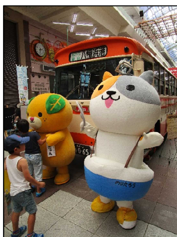
「のりたろう」と「みきゃん」のツーショット

今回は、国土交通省の公共交通利用促進キャラクターである「のりたろう」が四国初上陸したこともあり、愛媛県のイメージアップキャラクター「みきゃん」とともに、来場者のみなさん(特に、お子さんや女子高生)との記念撮影も行われていました。(愛媛県の局長さんから、「のりたろう」の参加にあたり、お礼の言葉をいただきました!)