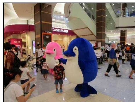
「ことちゃん」と「ことみちゃん」も参加しました

また、今回は3連休最終日(敬老の日)に開催したこともあり、親子連れに加えおじいちゃん、おばあちゃんたちも楽しんでくれたようでした。