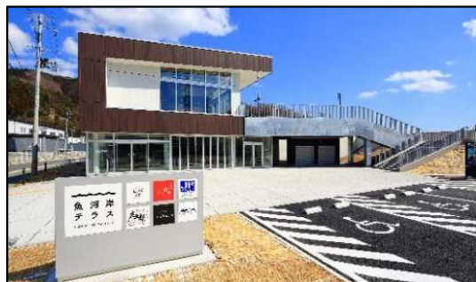
釜石魚河岸にぎわい館 「魚河岸テラス」