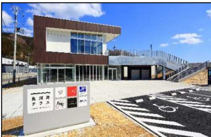
【代表施設】釜石魚河岸にぎわい館 「魚河岸テラス」