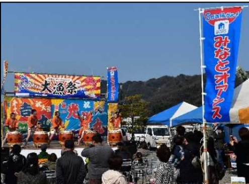
地域振興イベントの開催状況