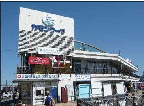
構成施設のイメージ