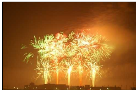
岸和田港まつり（花火大会）