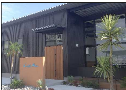
【代表施設】 Lucy's 'Aina