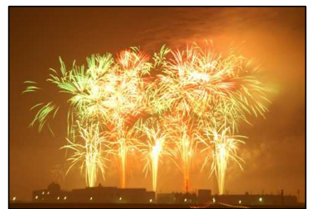
岸和田港まつりの花火大会

※ 「みなとオアシス」の関連情報については、下記 URL からご覧いただけます。