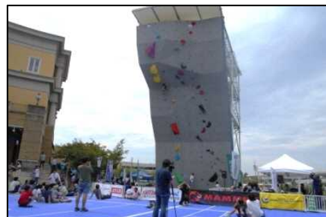
全国小学生クライミング大会